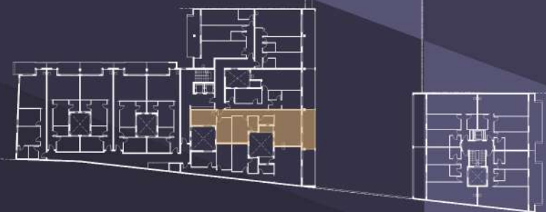
Planta Pisos - Escalera 1 - Vivienda 4